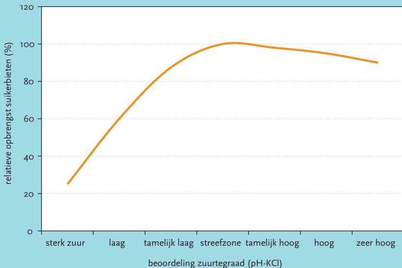
Figuur 1 Relatie tussen pH en opbrengst suikerbieten - BDB 2009

In de zandleemstreek heeft meer dan de helft van de suikerbietpercelen een te lage pH. Zeker bij zure tot sterk zure pH's mag je ernstige opkomstproblemen verwachten bij suikerbieten. Hier is een goed beredeneerde herstelbekalking onontbeerlijk voor een rendabele bietenteelt. Bij een te hoge pH daalt de opneembaarheid van