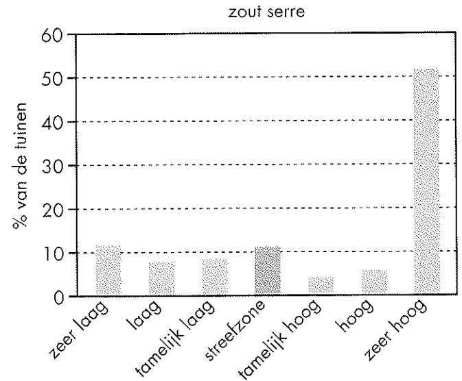
Tabel 2: Thematische procentuele verdeling van het zoutgehalte van de hobbyserres in zeven bodemvruchtbaarheidsklassen (geografisch niveau: Vlaanderen)

S. Deckers en A. Elsen, Bodemkundige Dienst van België