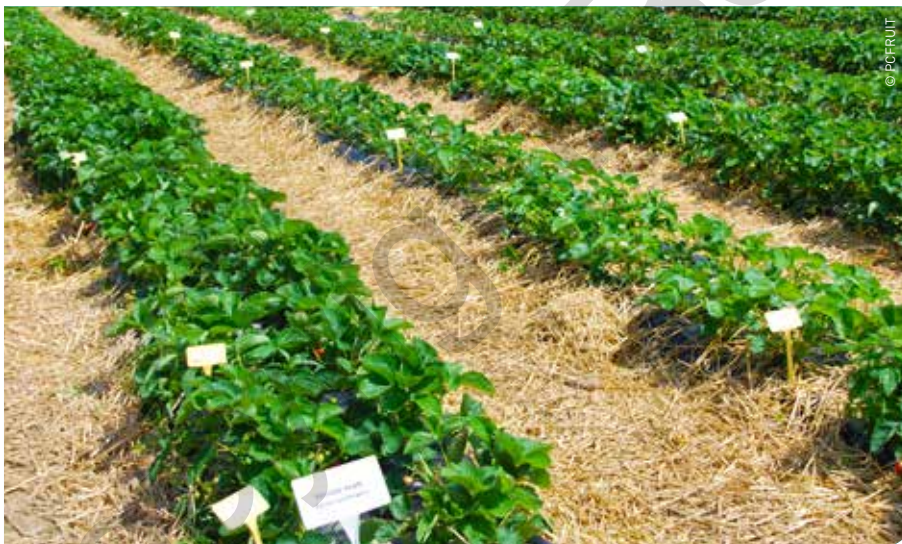
Voor een correcte bemesting met aandacht voor het nitraatresidu in het najaar moet er meer aandacht worden besteed aan de N-mineralisatie onder zwarte plastic.

voorziening wordt de mineralisatie extra gestimuleerd onder de geïrrigeerde aardbeiruggen ten opzichte van onder de niet-geïrrigeerde aardbeiruggen. Meer mineralisatie betekent een hogere vrijstelling van N.