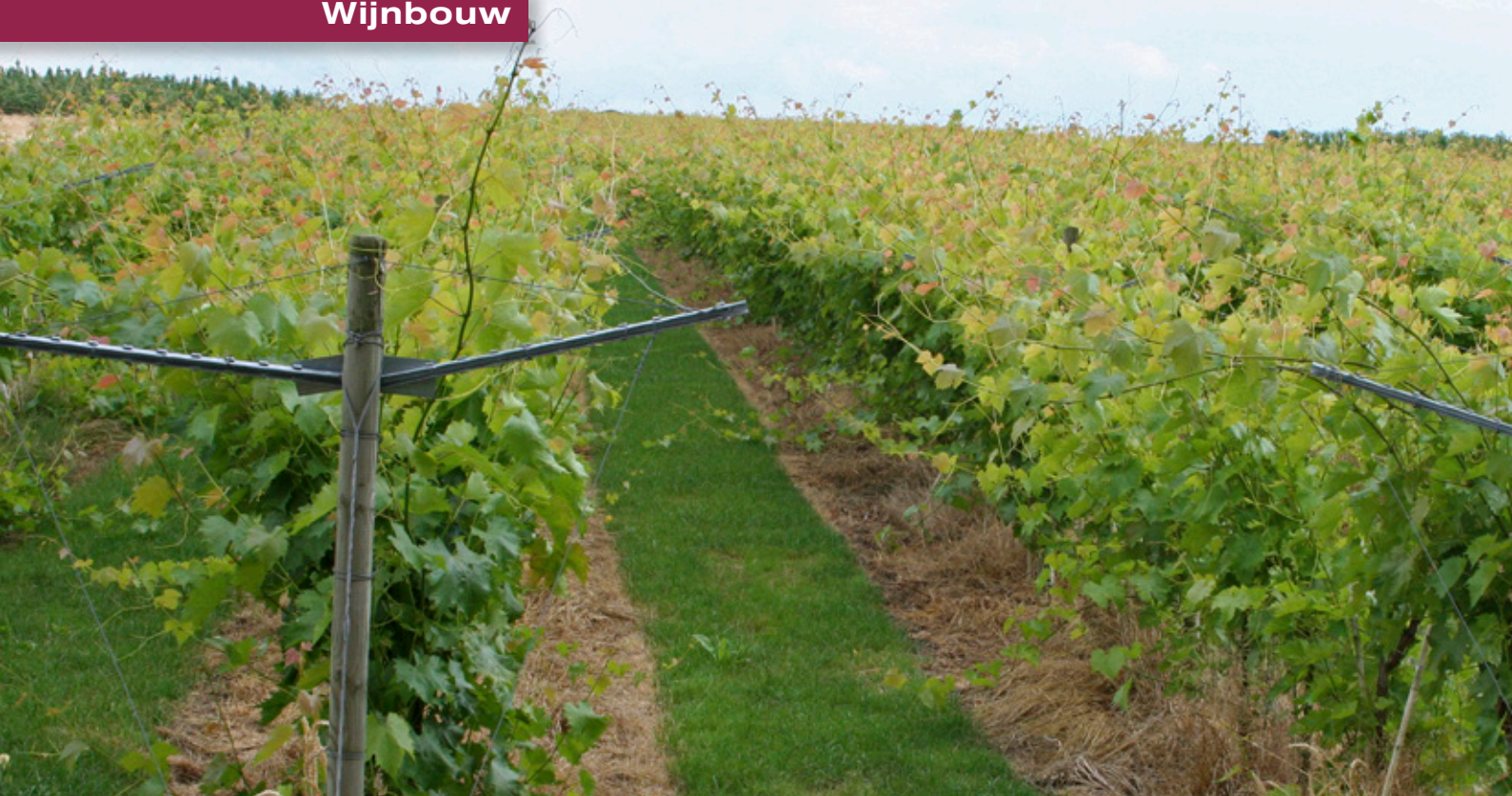
Foto 1. - Hellend perceel op het zuiden gericht is ideaal.