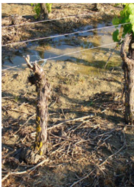
Foto 2. - Wateroverlast is nefast voor druivelaars.

De Belgische bodems worden geklas- seerd door het Centrum voor Bodem- kartering (CVB) in bodemseries. Een