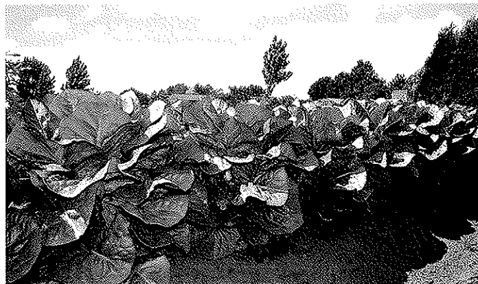
Onder: teler Fred Berkhout haalde positieve resultaten met humuszuren in bladgewassen en bleekselderij bij minder gunstige groei-omstandigheden.