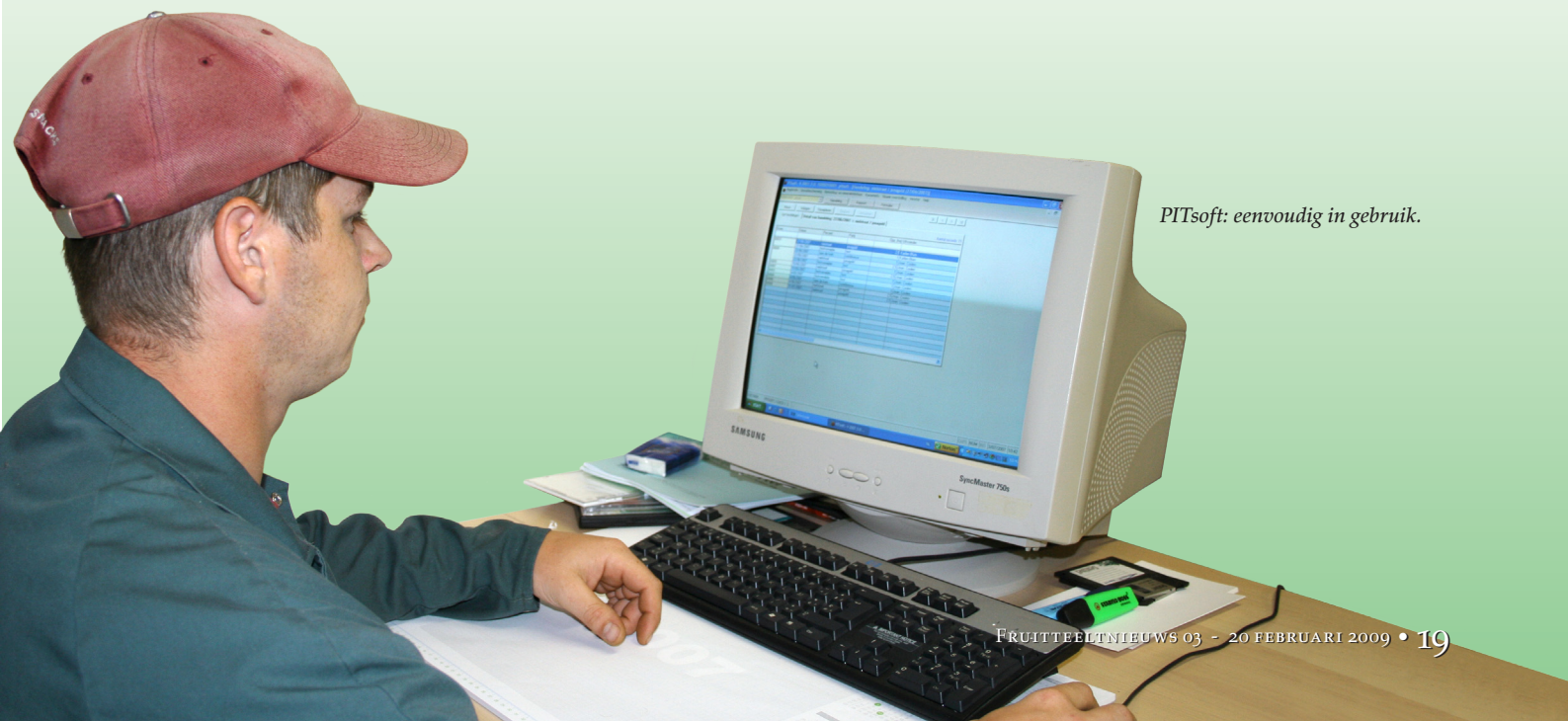
PITsoft: eenvoudig in gebruik.

Vooraleer ik een bespuiting uitvoer, gebruik ik de sproeiberekening om zo een goed idee te hebben van het benodigde watervolume en sproeistoffen.