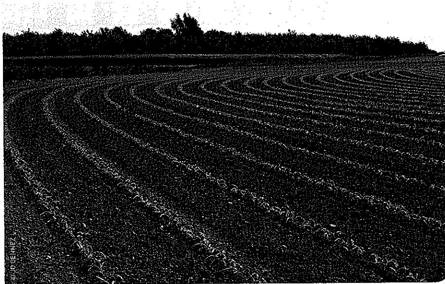
De bemestingsbehoefte van maïs wordt voornamelijk ingevuld via organische bemesting.