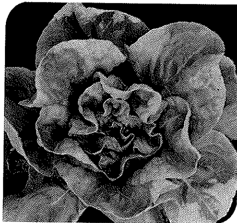
Mangaangebrek bij bonen en komkommer, mangaanovermaat in sla.

Bij de normale gehalten is er geen gevaar voor de gezondheid. Indien deze waarden echter sterk overschreden worden, dan spreekt men van een bodemverontreiniging en, afhankelijk van de hoeveelheid aanwezig in de bodem en over welk zwaar metaal het gaat, kan er dan er een gevaar bestaan voor de gezondheid van mens en dier en kan ook de plant schade ondervinden (verminderde groei, afsterven). De elementen koper en zink