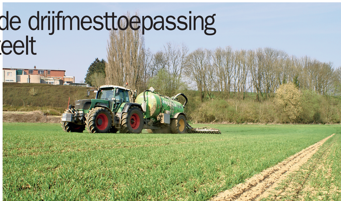
Een proef in Huldenberg in 2014 bevestigde het eerder getoonde potentieel van een drijfmesttoepassing op de wintertarwe in het voorjaar. De voorwaarde is wel dat de toepassing onder goede omstandigheden moet kunnen gebeuren.

Het toepassen van drijfmest in het voorjaar in de wintertarwe biedt mogelijkheden doch is tot nog toe een te weinig toegepaste praktijk. Dit ondanks het feit dat het een duidelijke kostenbesparing op de meststofenfactuur kan betekenen en het bovendien een praktijk is die vanuit milieustandpunt op veel bijval kan rekenen door de beperking van de ecologische voetafdruk. In dit opzicht is het aangewezen om de mogelijkheden van een drijfmesttoepassing in het voorjaar in wintertarwe 'in the picture' te plaatsen.